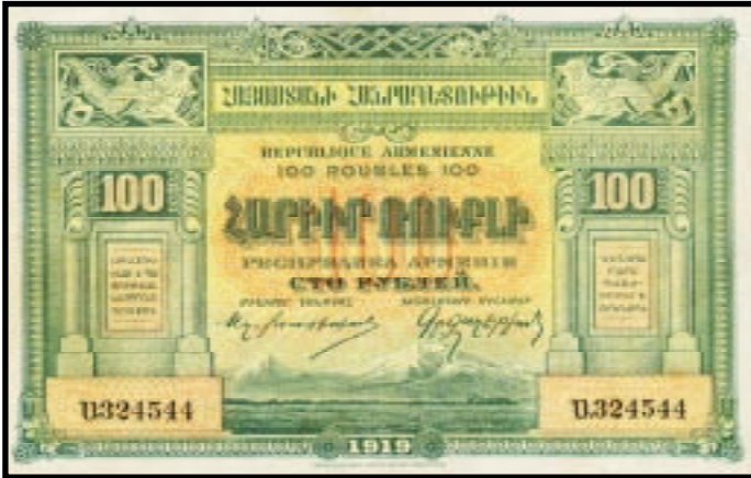
100 Rubel 1919 (mit dieser Datierung gibt es 5 verschiedene 100-Rubel-Noten)