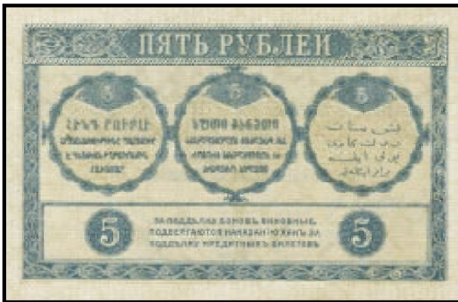
Transkaukasisches Kommissariat 5 Rubel 1918

Einen detaillierten Bericht über die Geldscheine Transkaukasiens können Sie in einem der nächsten Informations-Hefte des DGW e.V. lesen. Übrigens: Mitglieder des DGW erhalten diese Hefte automatische zugeschickt (kostenlos).