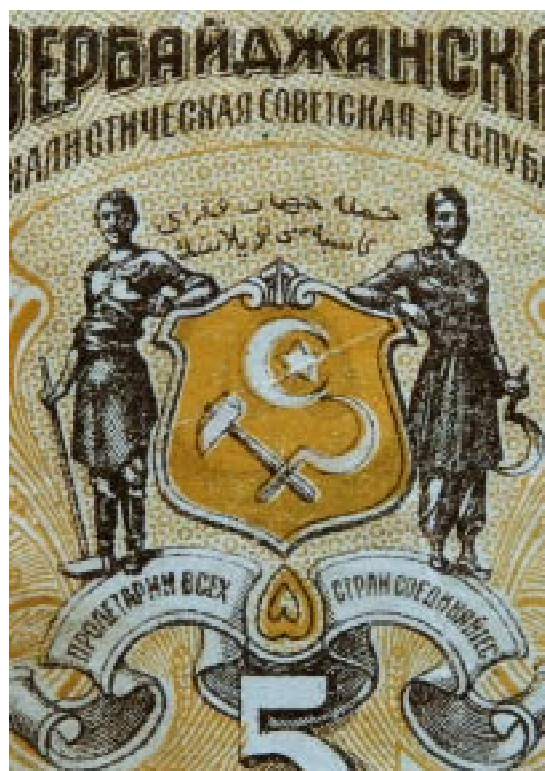
Ausschnitt Rückseite: russisch beschriftet, Wappenschild gehalten von einem Arbeiter und einem Bauern (jeweils mit Werkzeug), Losung auf dem Spruchband: russisch, darüber auf aserbaidsschisch