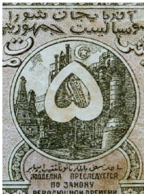
Ausschnitt Vorderseite: aserbaidsschisch beschriftet Wertangabe im Kreis vor Industrieanlage, mit Mondsichel und Stern