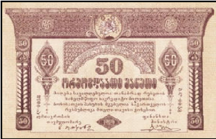
50 Rubel 1919

Insbesondere die Rückseite erinnert an die Geldscheine des Transkaukasischen Kommissariates.