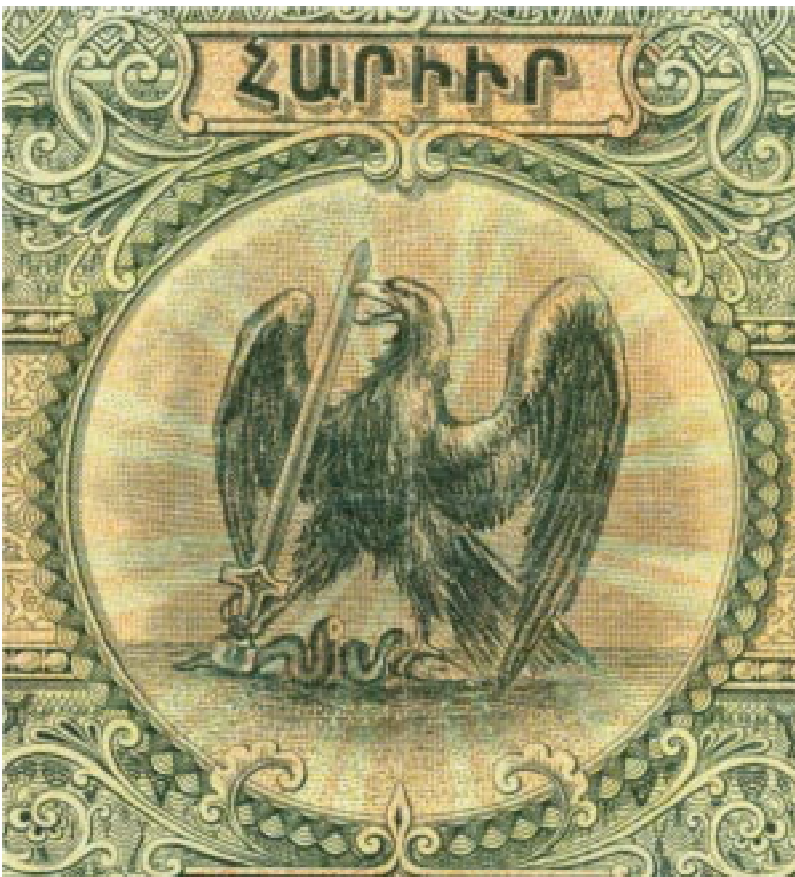
Detail Rückseite: Adler mit Schwert und zerteilter Schlange, darüber „Hundert“